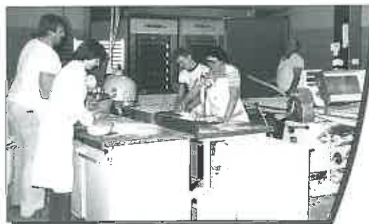
Backstube in Friesen

Lage und ein völlig neuer Betrieb wurde gebaut. 200 Quadratmeter Verkaufsfläche bieten dem Kunden ein neues, bequemes Einkaufen bei übersichtlichem Warenangebot, größtenteils in Selbstbedienung. Fachberatung der Kunden, ein Schwätzchen mit dem Verkaufspersonal, Austausch von Sorgen und Tagesneuigkeiten - dies belässt dem neuen, großen Laden einen Hauch von Tante-Emma-Nostalgie.