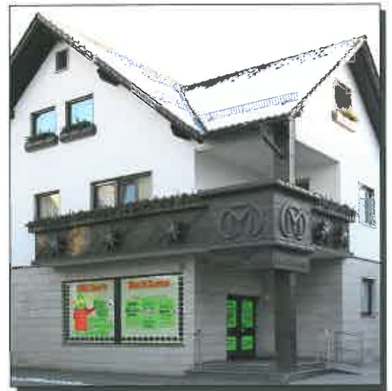
Hauptstelle in Friesen

1987 folgte der Beginn der Kernsanierungsarbeiten aufgrund von Bauschäden